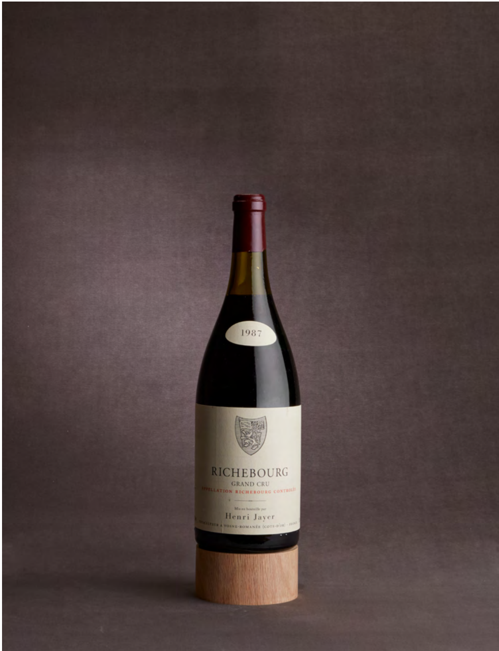
Lot 214 – Un magnum de Richebourg 1987