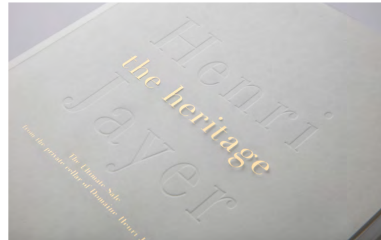
Le catalogue de la vente, en tirage limité.

Les prix des 215 lots qui seront soumis au marteau s’échelonnent de CHF 3’200 pour une bouteille de Nuits-Saint-Georges 1997 (lots 6 & 7) à CHF 280’000 pour une verticale de 15 magnums de 1978 à 2001 (lot 160), pour un ensemble estimé entre CHF 6,7 et 13 millions, soit entre 6 et 11 millions d’euros.