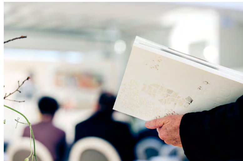
1 — “Burgundies, Whiskies”

En doublant le score de sa vente inaugurale de décembre 2015, Baghera/wines s’impose, dès sa deuxième vente, comme le leader suisse des ventes aux enchères de vins d’exception.