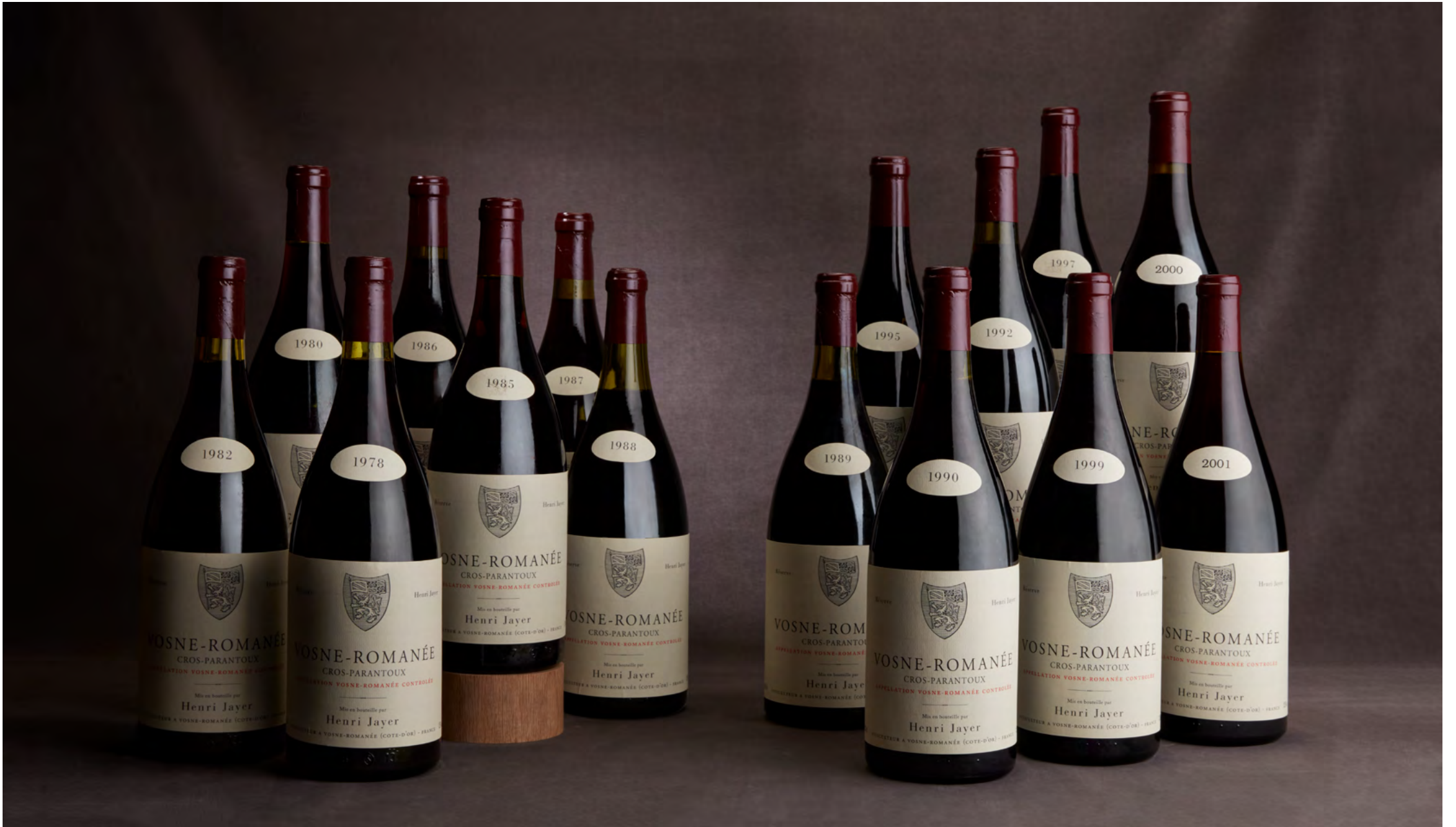
Lot 160 – Vosne-Romanée Cros-Parantoux, Verticale de 1978 à 2001, 15 magnums.