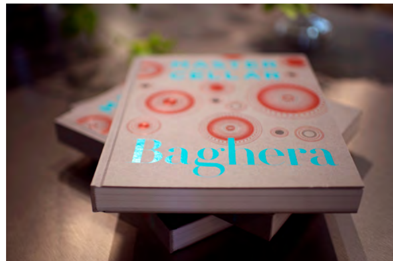
2 — “Master cellar”