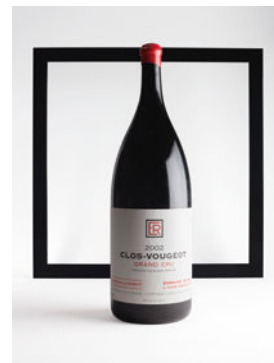
LOT 140 Clos-Vougeot 2002 1 mathusalem CHF 7'500 - 15'000