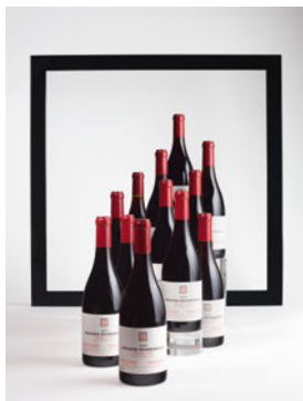
LOT 120 Grands-Échezeaux 1999 12 bouteilles CHF 12'000 - 30'000