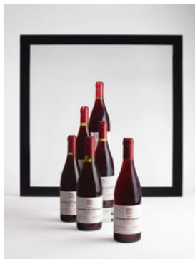
LOT 129 Grands-Échezeaux 1965 6 bouteilles CHF 6'000 - 18'000