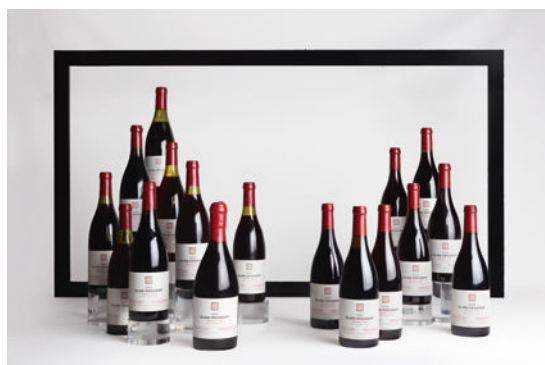
LOT 167 Verticale Clos-Vougeot 2001 à 1955 17 bouteilles CHF 15'000 - 45'000