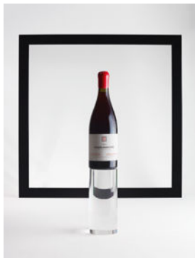
LOTS 42, 43, 44 Vosne-Romanée 1921 1 bouteille par lot CHF 1'500 - 4'000