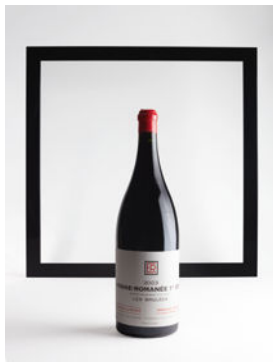
LOT 51 Vosne-Brulées 2003 1 jéroboam CHF 2'000 - 4'000