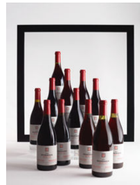
LOT 101 Verticale Échezeaux 2004 à 1970 12 bouteilles CHF 7'500 - 18'000